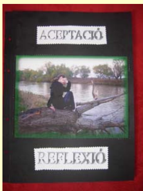
MIRADA A L'INTERIOR