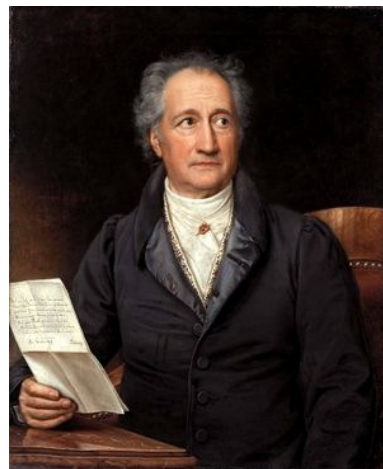
Johann Wolfgang von Goethe