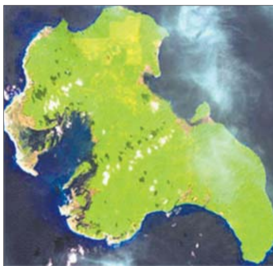
Bahía sumergida por el tsunami en la isla de Katchall, en el archipiélago indio de Nicobar, al norte de Sumatra.

que vuelvan a ser destruidos por otro tsunami y la política de prevención que adopten los Gobiernos de la zona. Recuerdo que, tras el tsunami de 1998 en Papúa Nueva Guinea, los expertos aconsejaron no reconstruir los pueblos en el mismo sitio en que estaban, debido al riesgo extremo de nuevos maremotos. Pero la verdad es que la mayor parte de la gente no tenía otro sitio adonde ir, de modo que acabaron volviendo al mismo lugar”.