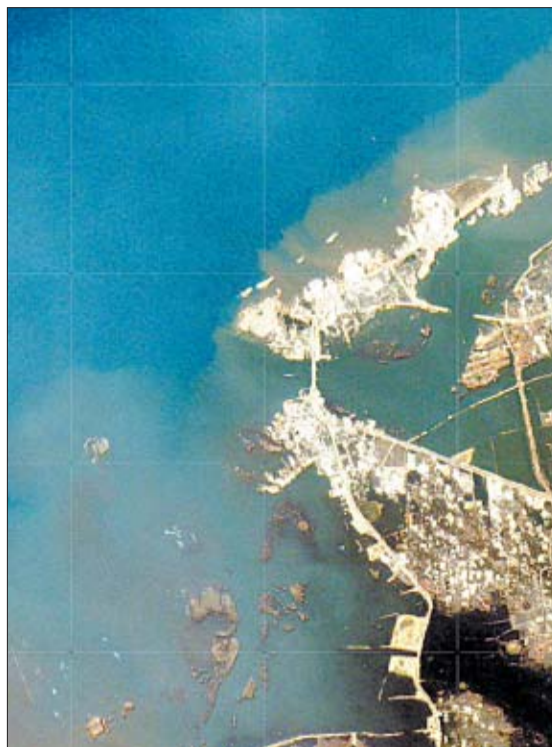
El par de fotos por satélite (antes y después del tsunami ) muestra la devastación en Banda Aceh, norte de Sumatra.